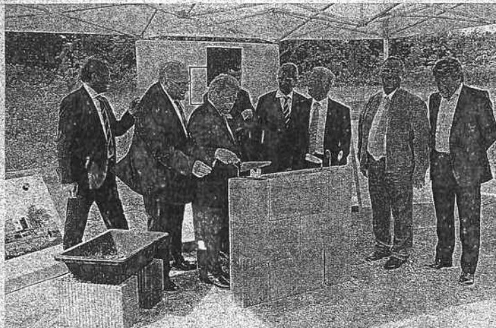
La première pierre de l'EHPAD "Les Fontaines" a été posée, hier, à Kembs.