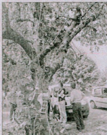
La majorité des arbres existants a été conservée.